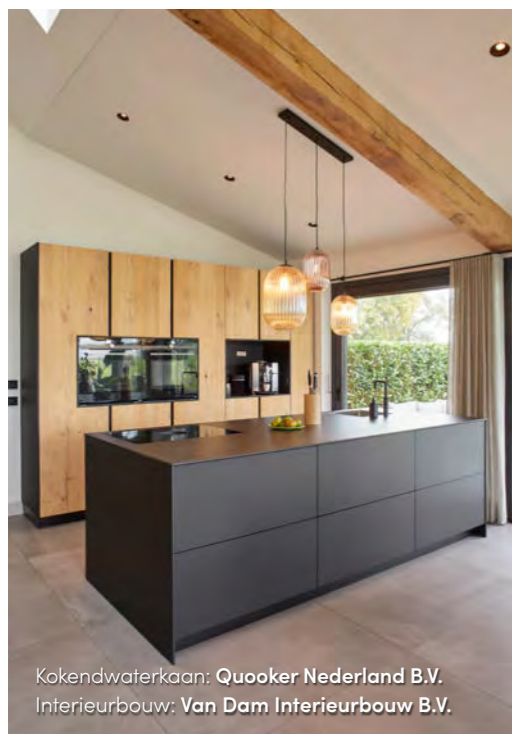
Kokendwaterkaan: Quooker Nederland B.V. Interieurbouw: Van Dam Interieurbouw B.V.