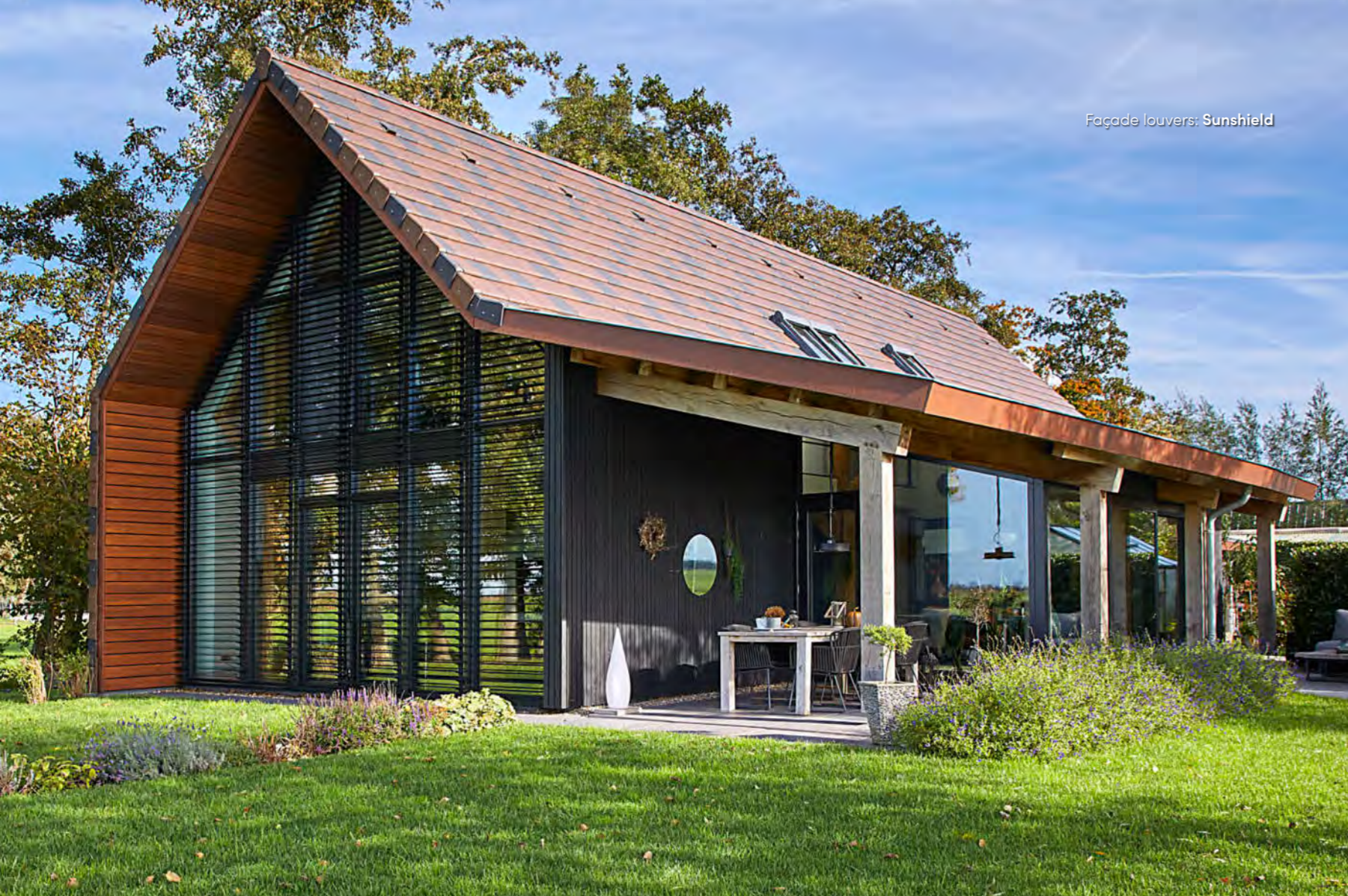
Façade louvers: Sunshield