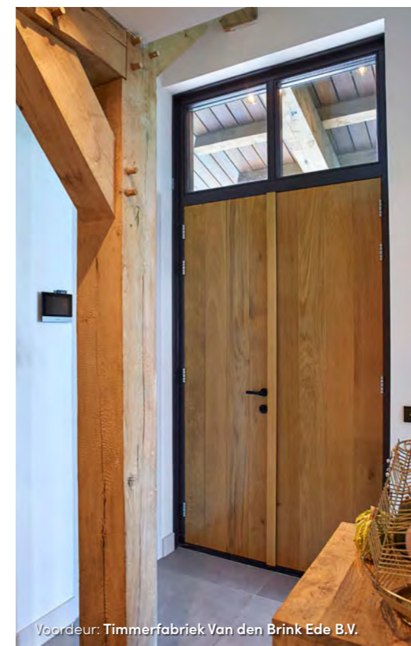
Voordeur: Timmerfabriek Van den Brink Ede B.V.