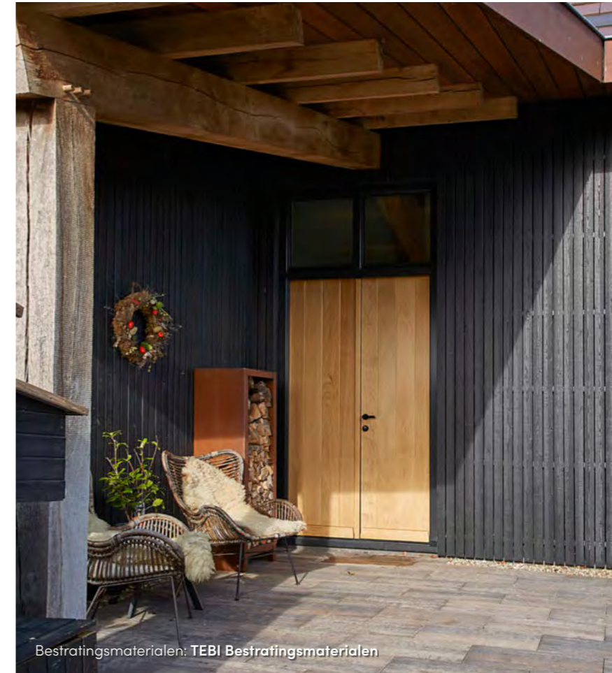
Bestratingsmaterialen: TEBI Bestratingsmaterialen