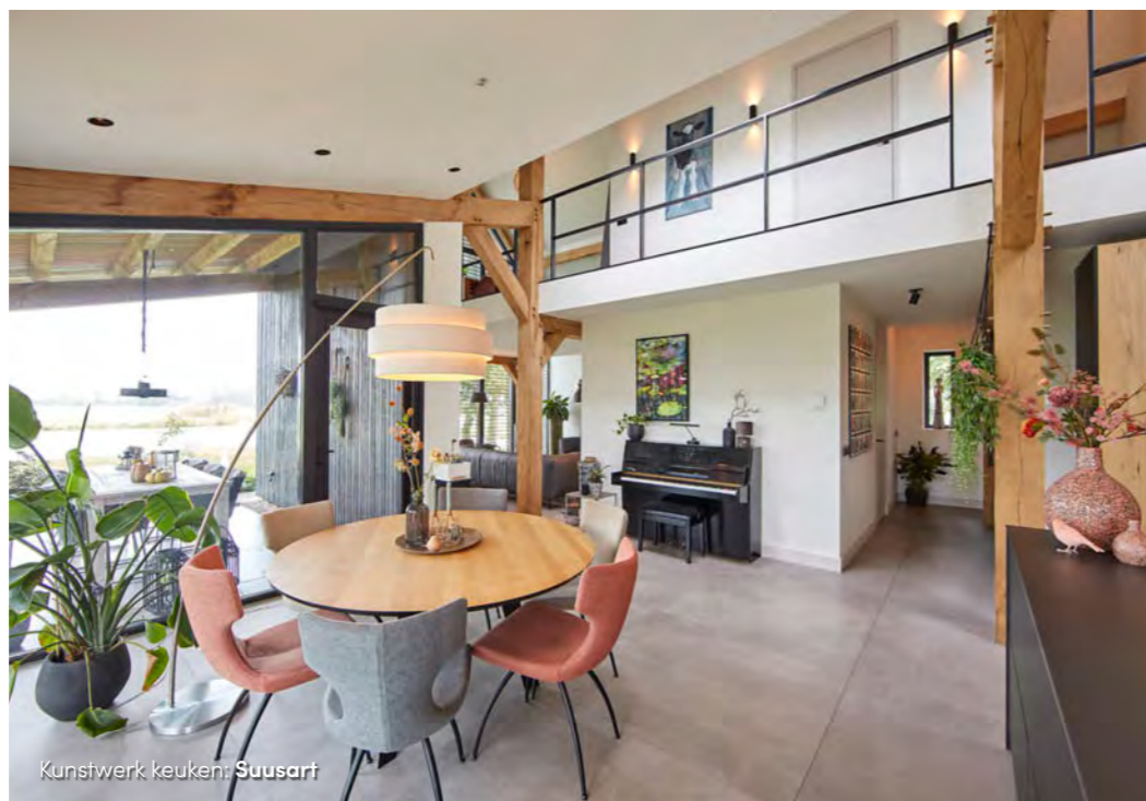
Kunstwerk keuken: Suusart